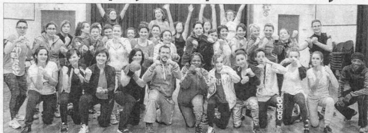
Les moniteurs et le groupe féminin à l'issue de l'entraînement.