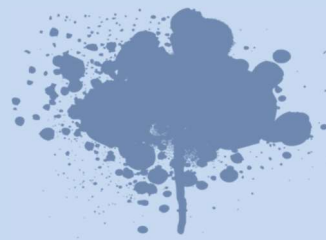
Œuvre de Lucie LLONG