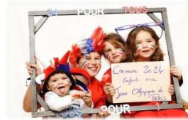
Présence de champions et d'artistes lors de cette inauguration.

« 24 pour tous, tous pour 1... là où tout commence. »