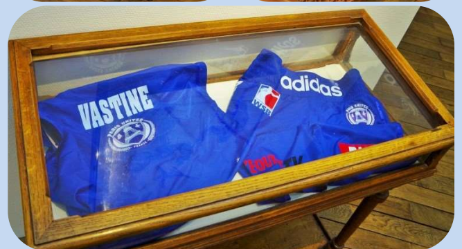
Quelques œuvres, tenues ou objets exposés