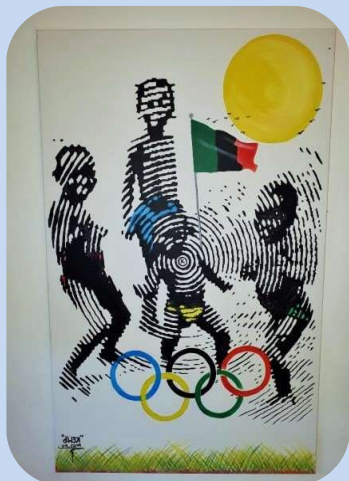
Œuvre de Kemp NDAO